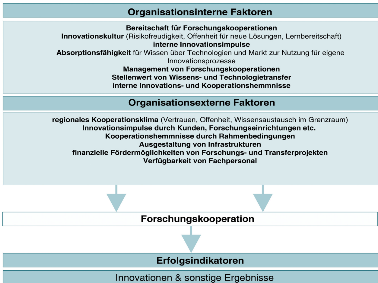
Abbildung 3: Ermittelte Einflussfaktoren für das Zustandekommen von Forschungsk Kooperationen