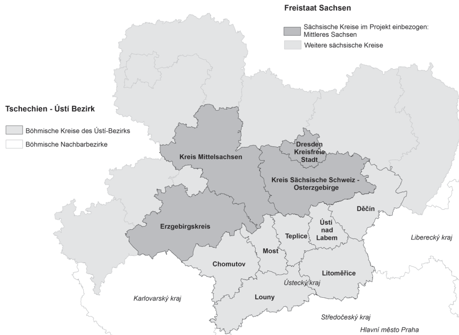
Abbildung 1: Untersuchungsgebiet der empirischen Studie

Bei den untersuchten Unternehmen handelt es sich mehrheitlich um kleine und mittlere Unternehmen. Lediglich etwa fünf Prozent der befragten Unternehmen im mittleren Sachsen und aber fast 15 Prozent der befragten Unternehmen im Ústí-Bezirk beschäftigen mehr als 249 Mitarbeiter/innen. Die Mehrheit der befragten Unternehmen beider Regionen ist im verarbeitenden Gewerbe tätig. An zweiter Stelle rangieren im sächsischen Teil des Untersuchungsgebietes die Unternehmen, die Dienstleistungen für Unternehmen erbringen. Im Ústí-Bezirk sind es die Unternehmen im Baugewerbe. Die befragten Forschungseinrichtungen stammen mehrheitlich aus Hochschulen und Universitäten.