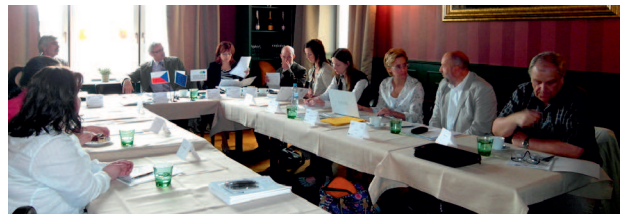
Gruppendiskussion mit Vertretern der regionalen Handels- und Wirtschaftskammern (u. a. OHK Děčín, OHK Most) in Ústí nad Labem

Diskussionsforum mit dem Titel „Handels- und Wirtschaftskammern als Schlüsselakteure regionaler sowie grenzüberschreitender Kooperation“