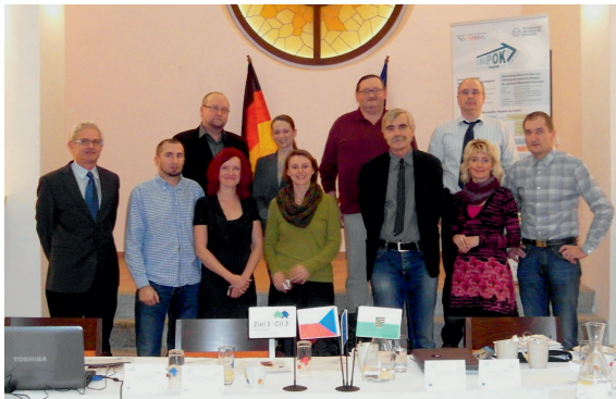
Teilnehmer/innen der böhmisch-sächsischen Gruppendiskussion in Dolní Poustevna (am 22.11.2012), die einen der Impulse für die Auswahl der Modellregion gegeben hat.

Ein solcher Ansatz ist die Kooperationsbörse.