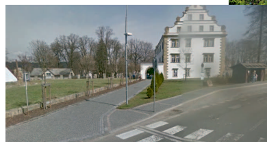
Schloss Šluknov/Schluckenau