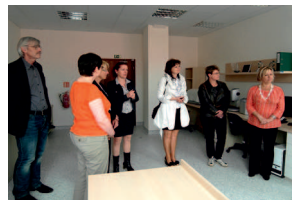
Forschungs- und Entwicklungszentrum in Šluknov

Besichtigung des Forschungs- und Entwicklungszentrums in Šluknov bzw. Besichtigung des Ausbildungszentrums der Tschechischen stomatologischen Akademie in Most (in Zusammenarbeit mit dem Unternehmerzentrum Rumburk)